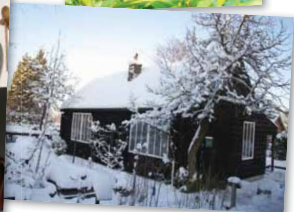
Een greep uit de gekozen ansichtkaarten.